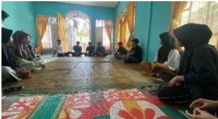
Gambar 4. Evaluasi Kegiatan Sosialisasi Tanaman Obat Keluarga

Pada tahapan ini mahasiswa KKN meninjau kembali hasil dari tahapan sebelumnya terkait kegiatan sosialisasi ini. Secara umum kegiatan ini dapat dikatakan berhasil karena pertama dapat menghadirkan masyarakat untuk mengikuti kegiatan pemberdayaan masyarakat melalui sosialisasi penyuluhan budidaya TOGA di Jorong Sawah Ampang. Kedua capaian dari tahapan perencanaan dijalankan dengan baik karena pada saat penyampaian materi, pemateri bisa memberikan dengan maksimal, terakhir pada tahapan pelaksanaan dapat dikatakan berhasil karena banyak peserta sosialisasi yang berinteraksi aktif dengan narasumber atau pemateri.