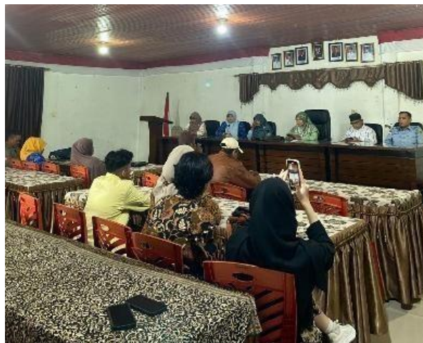
Gambar 1. Persiapan Proker TOGA di Jorong Sawah Ampang