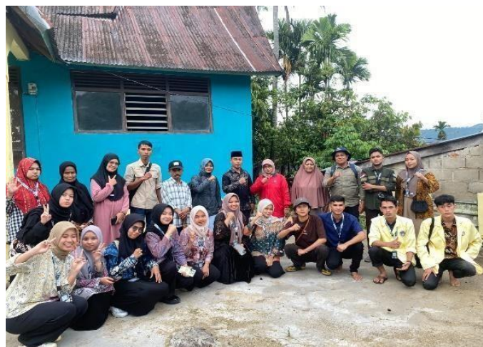
Gambar 3. Foto Bersama setelah Sosialisasi Tanaman Toga