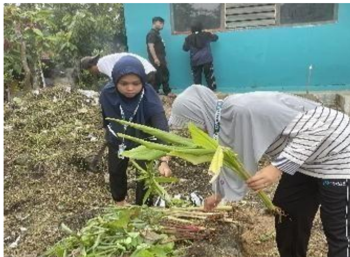
Gambar 2. Kegiatan Pelaksanaan Tanaman Obat Keluarga